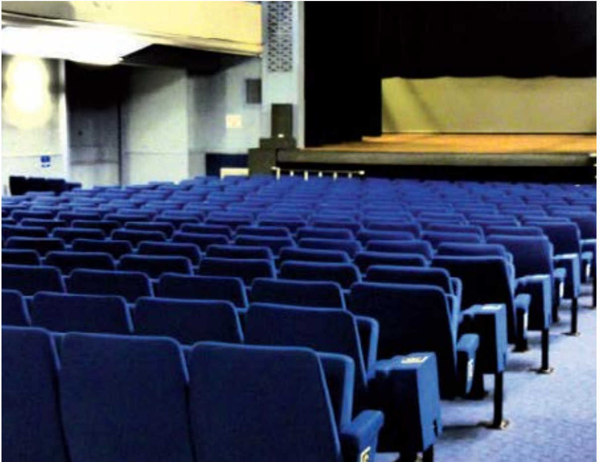
Parterre 344 places + 10 PMR