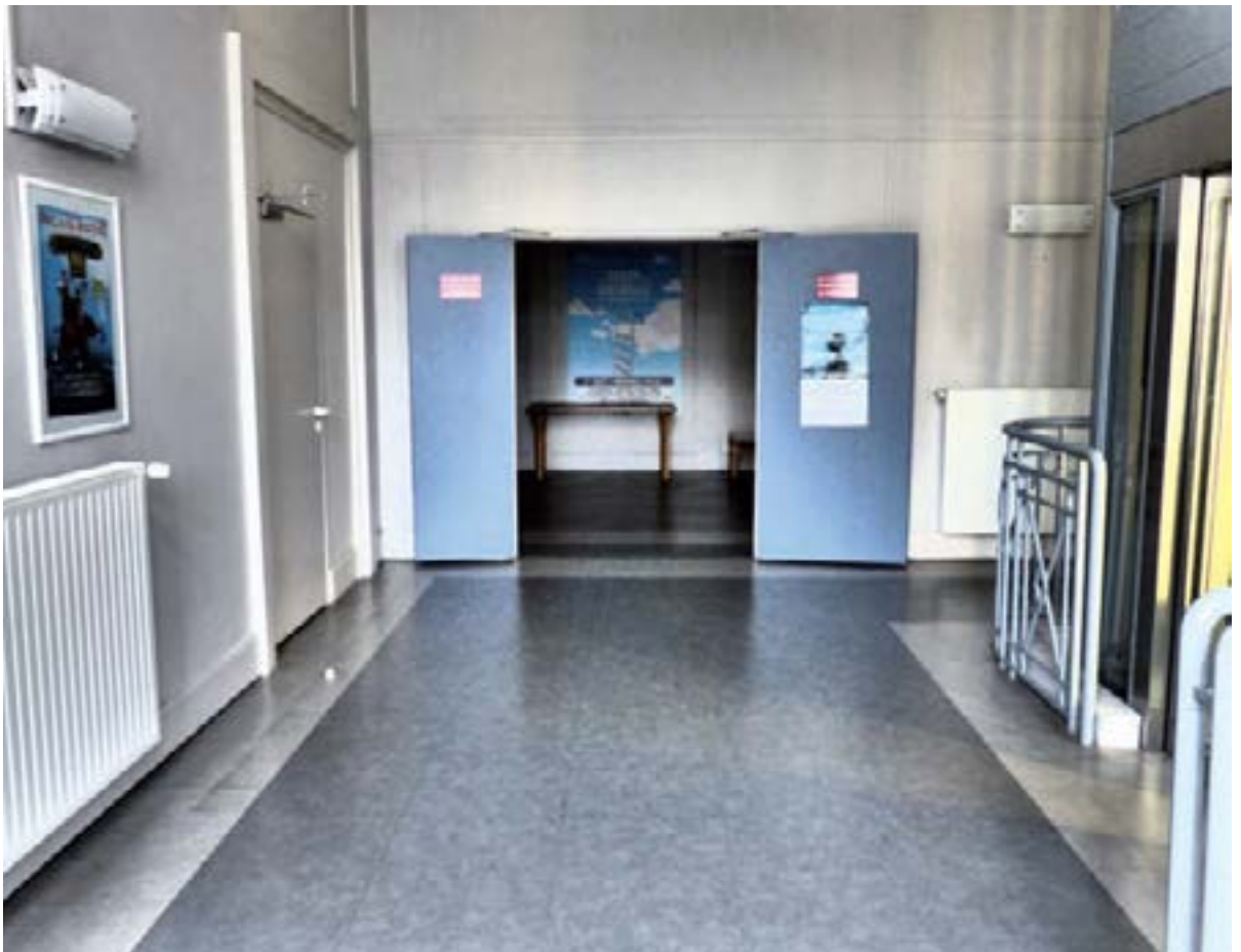
Billetterie et hall d'accueil public